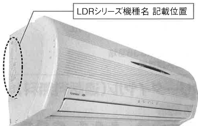
LDRシリーズ機種名 記載位置

RAS-225LDR 255LDR 285LDR 325LDR 406LDR 506LDR 255LDR-D 285LDR-D 406LDR-D 255LDR-G 285LDR-G 2559SDR 2859SDR 4069SDR V285DR